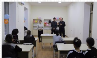
16-noyabr “Xalqaro bag‘rikenglik kuni”