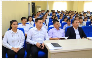
Dekan va yoshlar uchrashuvi