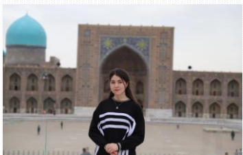
Tanlov-Birgalikda yurtimiz bo'ylab sayohat qilamiz!