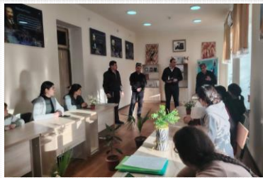
Milliy urf-odat, qadriyat va an’analar – tarbiya asosi