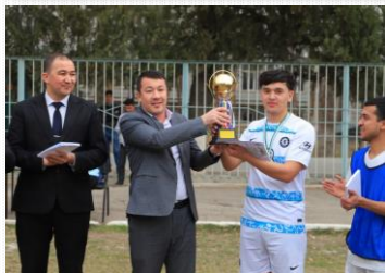
“Dekan kubogi”- 2024