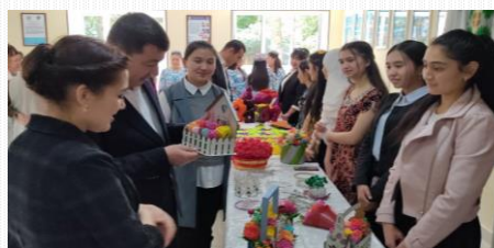
“Ustoz ilimli-shogird bilimli”