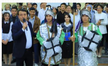
Talabalar teatri musobaqasi