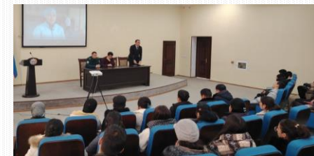
"Yoshlar giyohvandlikka qarshi!"