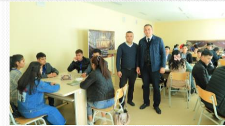
Fakultet talabalari o‘rtasida “Zakovat” musobaqasi