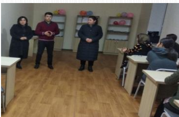
“Tarbiya biz uchun yo hayot — yo mamot, yo najot — yo halokat, yo saodat — yo falokat masalasidir”